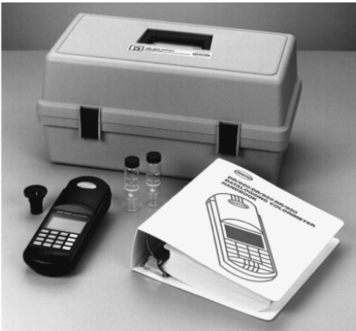
图 1 DR/800 系列色度仪标准包装*